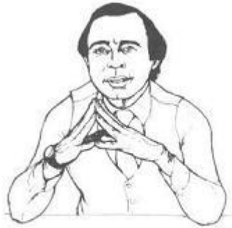
The raised steeple