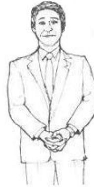
Hands clenched in lower position