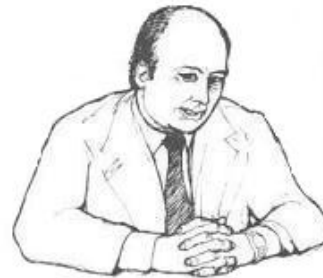
Hands clenched in middle position