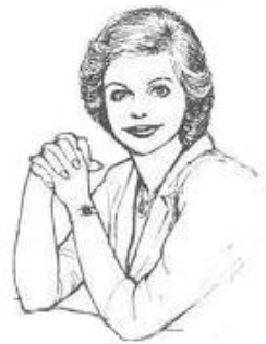
Hands clenched in raised position